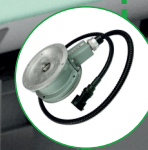
съем сигнала с расходомера с топлива раздачи