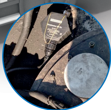
Eurosens Dominator RS датчик уровня заполнения